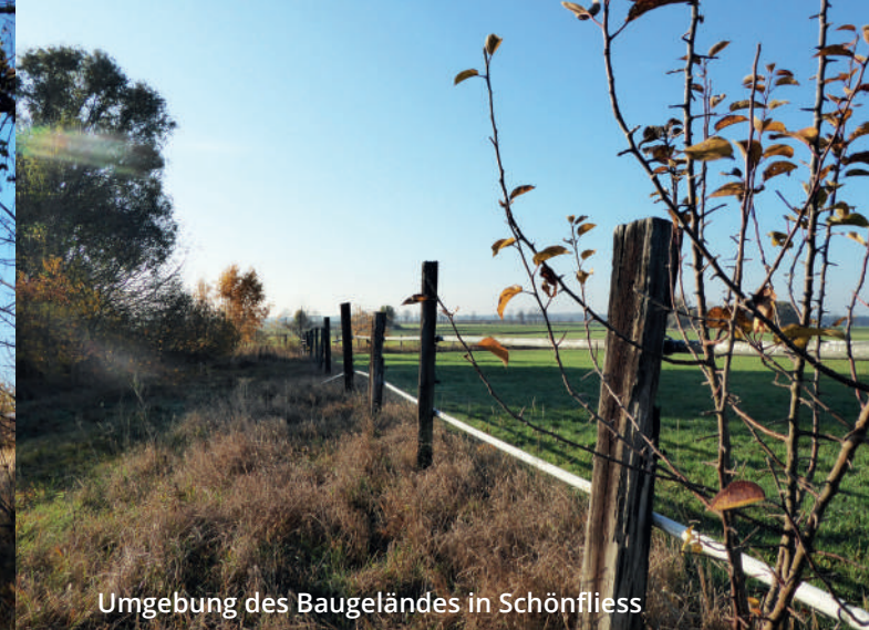
Umgebung des Baugeländes in Schönfliess