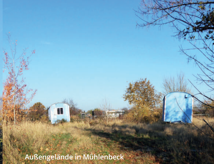
Außengelände in Mühlentbeck