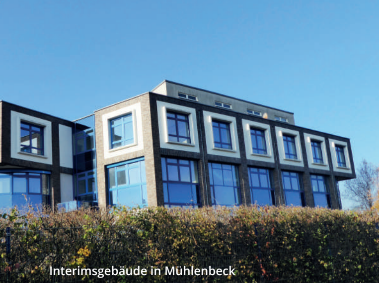
Interimsgebäude in Mühlentbeck